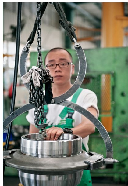
专业翻新磨损刀具是海瑞克刀具工厂的核心功能之一

我们借助丰富的项目经验，针对预期的地质条件，就选用哪种类型的刀具和在什么时间更换刀具向客户提出建议。有些特定的刀具还装备了一个专业磨损测量系统（滚刀滚动监控系统 DCRM），这个系统可以准确可靠地预测磨损情况。因此，每次更换的时机可以精确预测并且可以避免因过度磨损导致对刀盘钢结构部分的伤害。