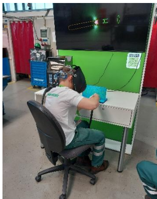
Bild 2: Herrenknecht-Ausbildungstag – ein Auszubildender zeigt den Schweißsimulator.