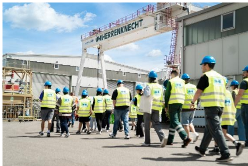
Bild 1: Werksrundgang beim Herrenknecht-Ausbildungstag – mit Helm und Warnweste.